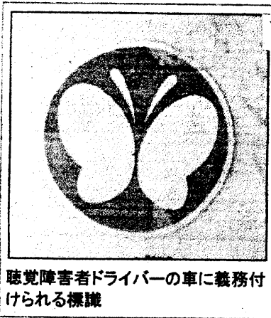
聴覚障害者ドライバーの車に義務付けられる標識

ワイドミラーの装着やマークの表示を怠った場合には、二万円以下の罰金。マークを付けた車に幅寄せや割り込みをすると、五万円以下の罰金が科せられます。